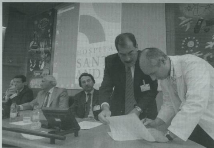
CONTRATUALIZAÇÃO Documento foi assinado entre Administração e todos os serviços hospitalares

ção dos seus objectivos. “É um modelo de gestão que depende, em grande medida, do desempenho dos profissionais da instituição, estimulando o seu envolvimento, numa base de confiança e de responsabilização mútuas. É nesta base que podemos dizer que os êxitos que temos eventualmente conseguido se devem ao empenho, à disponibilidade e dedicação